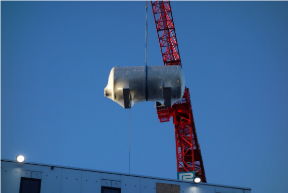
Kein Thema für den Kran ...

Inspiriere dich durch ein paar spannende Bilder der Tank-Transporte!