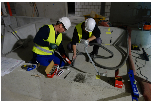
Montage der Unterkonstruktionen der Wassertanks.