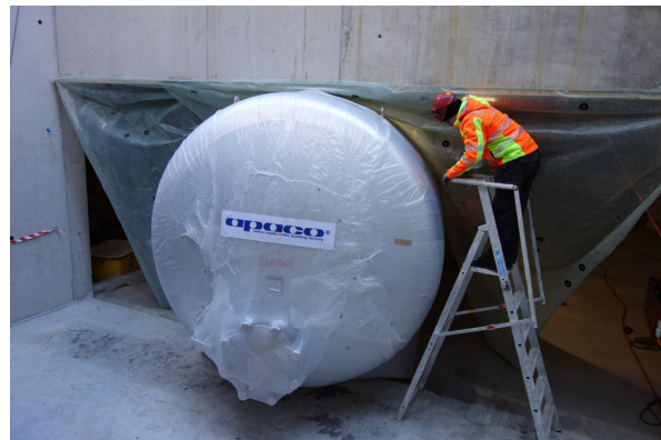
... in der Höhe war es dagegen recht knapp.