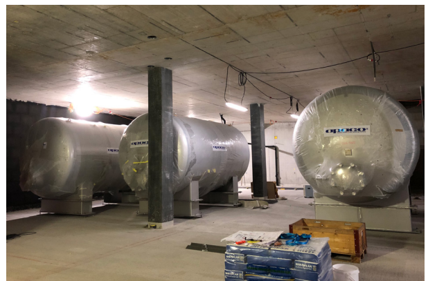
Tanks bereit zum Bodenaufbau.