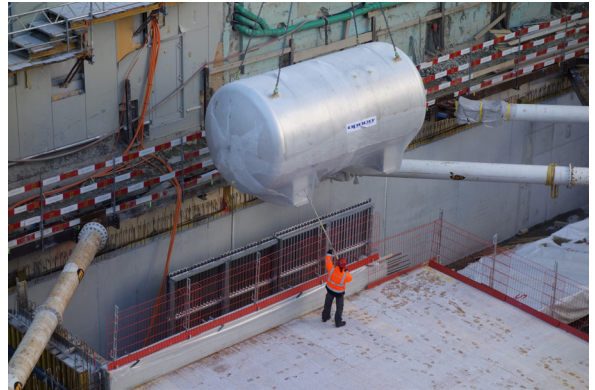
... wenn man mit dem Besenstiel etwas «fein-justiert».